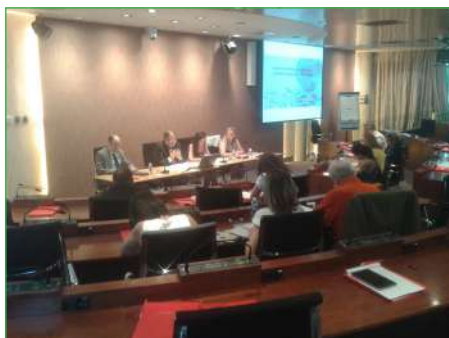
Encuentro Red de Cátedras Santander RSC