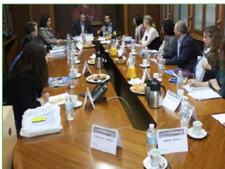
Jornada Diálogos Corresponsables