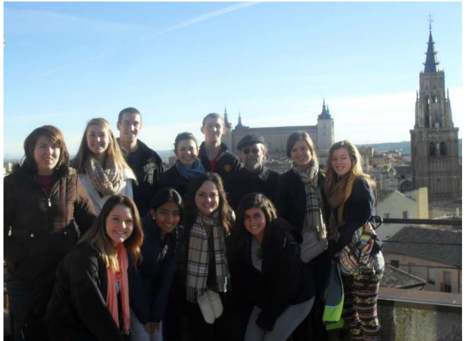
Grupo de alumnos del programa ESTO

En cuanto a las iniciativas más destacadas del programa ESTO, pueden resaltarse los estudios que alumnos/as de Filología Hispánicas chinos que realizan su tercer año de grado en inmersión, el Diploma de Español Fines Profesionales, donde una veintena de alumnos/as realizan estudios de español como lengua de especialidad; el curso de estudiantes chinos que acceden a cualquier universidad española una vez finalizado su curso de intensivo de español; el curso de lengua y cultura española de verano denominado Julio Abierto donde la interculturalidad y la convivencia hacen de bandera del aprendizaje de español y el Diploma de Español Lengua Extranjera, donde se establece una cercana y continuada colaboración con el Instituto Cervantes.