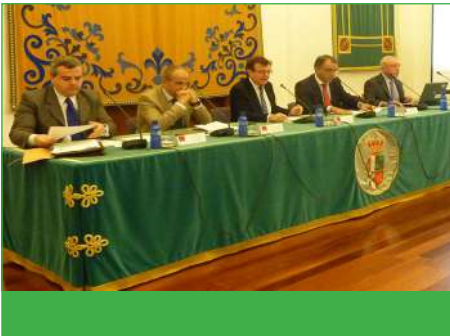
Jornadas Banca y Sociedad