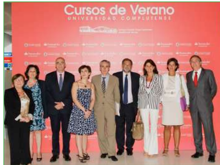
Curso de Verano Acción Social y Voluntariado