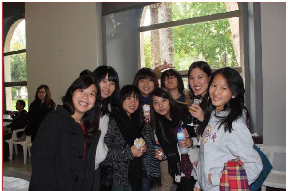
Grupo de alumnas del programa ESPACU

En febrero de 2013 ESPACU firmó un acuerdo con el Instituto Internacional de Comercio ITI, dependiente de la Cámara de Comercio Taiwanesa (TAITRA) a través del cual sus estudiantes se han incorporado por primera vez al curso anual.