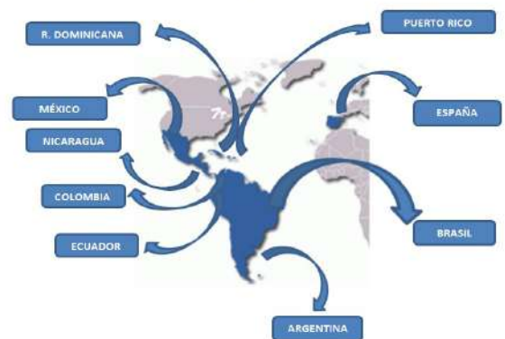
MAPA - PROCEDENCIA DE LOS ESTUDIANTES I POSTGRADO

Adicionalmente, se ha construido el Sistema Iberoamericano de Información en Derechos Humanos (SIIDHU), como una herramienta que permitirá en medio plazo integrar experiencias, iniciativas y contactos de los diferentes países de la región, a la vez, que aportar un conjunto de instrumentos formativos y de investigación imprescindibles para el trabajo de profesionales y técnicos en los temas del desarrollo .