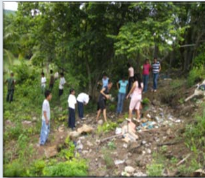
Limpieza del terreno