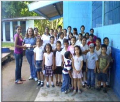
Entrega de semillas