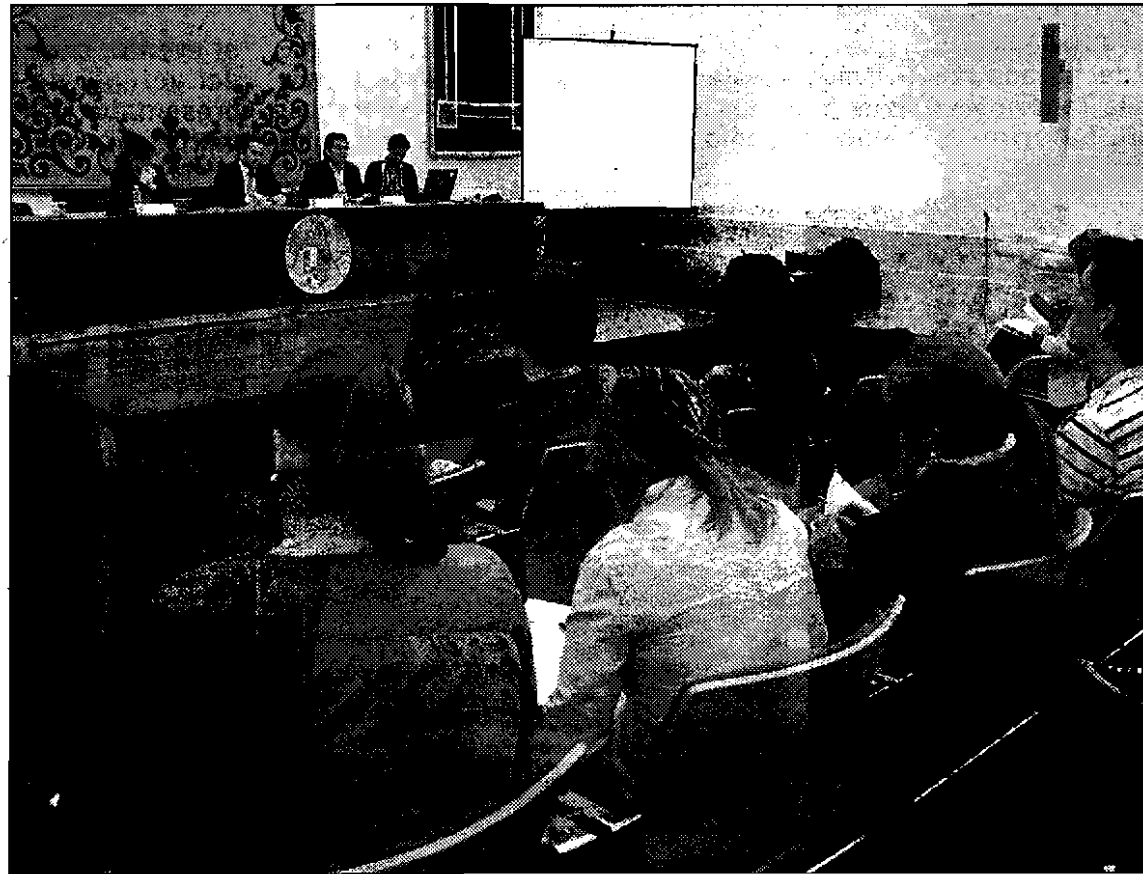
Más de 200 alumnos participaron en las jornadas sobre Colombia

De Páramo adelantó que en para próximas ediciones las jornadas