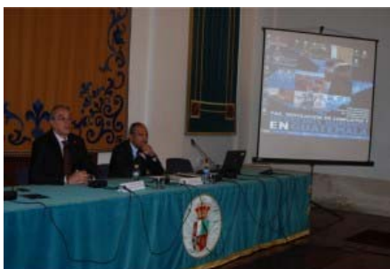
Un momento de las jornadas celebradas hoy.

Las VIII Jornadas Interuniversitarias de Cooperación que se celebran en la Universidad de Castilla-La Mancha (UCLM) analizarán los derechos humanos en Guatemala. Para ello se incidirán en actuaciones pasadas que se han llevado a cabo en el tiempo y las líneas que se han puesto en marcha para conseguir mejorar el presente de este país.