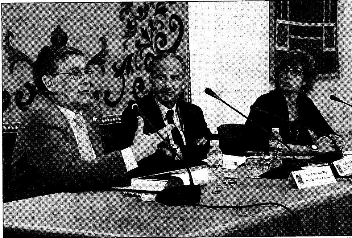
Las jornadas se celebraron en el Paraninfo del Rectorado de la UCLM

Sobre las jornadas, explicó que en la octava edición "hemos elegido Guatemala porque represen-