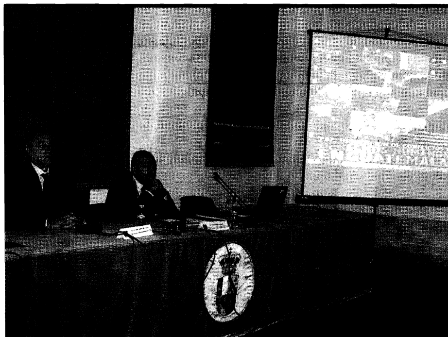
Derechos humanos. Las octavas jornadas interuniversitarias de cooperación que se celebran en la Universidad de Castilla-La Mancha analizarán los derechos humanos en Guatemala. Para ello se incidirán en actuaciones pasadas que se han llevado a cabo en el tiempo y las líneas que se han puesto en marcha para lograr mejorar el presente de este país.