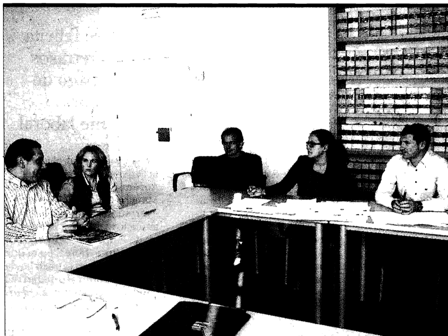
Apepal reclama el pago de libros. La Asociación provincial de empresarios papeleros y librerías (Apepal) volvió a reclamar ayer el pago de los libros del curso 2011-2012, aún sin abonar por la Junta y manifiesta su descontento ante su decisión de centralizar sus compras de papelería y material de oficina a empresas de fuera de la región