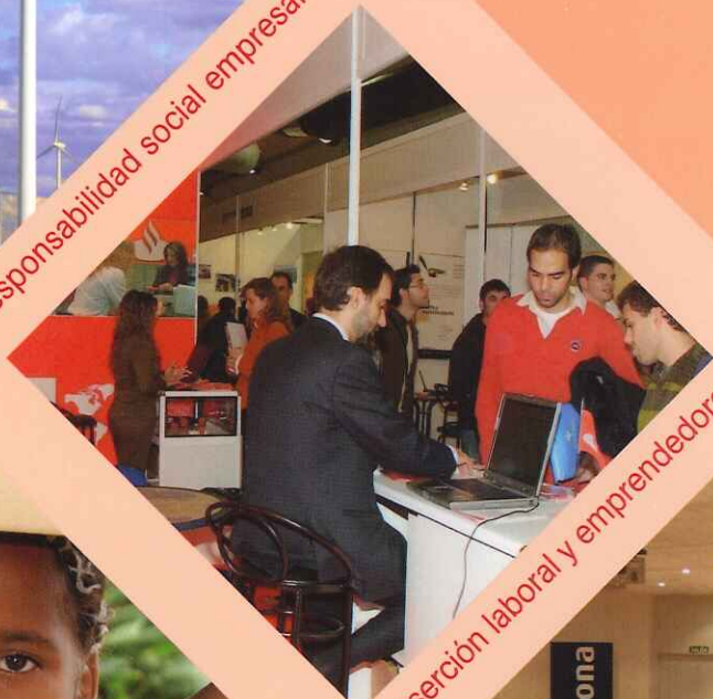
inserción laboral y emprendedores