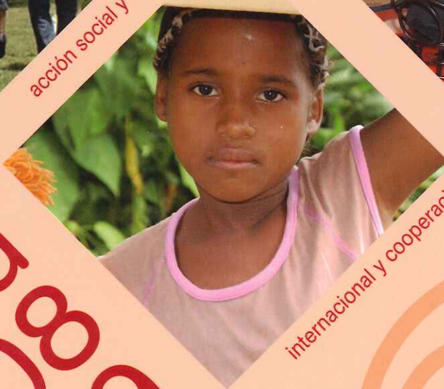
internacional y cooperación