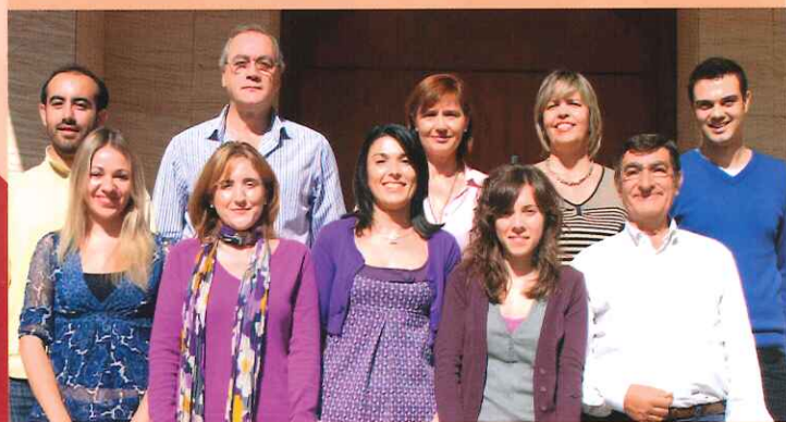
Equipo de trabajo Fundación General de la UCLM